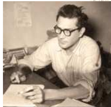
Maisons Alfort, 1953-1954