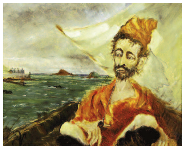
Tristan Corbière, huile sur carton de Jean Vacher Corbière