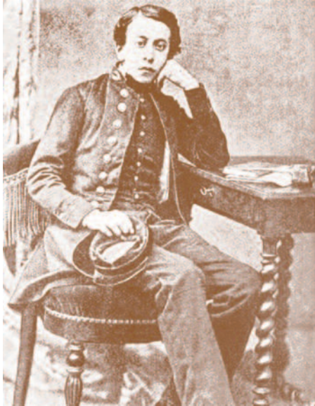
Tristan Corbière 1845-1875