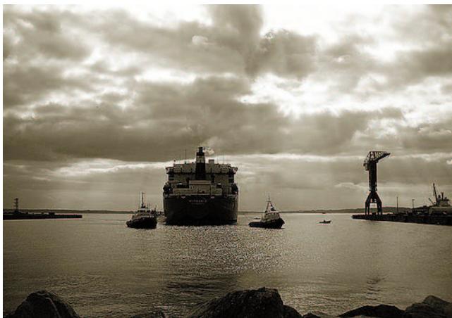
Photographie de Louis Brauquier

Quel plaisir que de redécouvrir réunies dans le recueil "Je connais des îles lointaines". Les oeuvres poétiques complètes de Louis Brauquier rééditées avec bonheur par les Editions de la Table Ronde. "Et l'au-delà de Suez", "Le Bar de l'Escale", "Eaux Douces pour Navires", "Pythéas", "Libertés des Mers", "Ecrits de Shangai", "Feux d'Epaves", "Hivernage", "Le Cyprès Couronné de Myrthe"(provençal et traduction) : ils sont tous là, ces poèmes qui plantent le décor des grandes villes portuaires où Marseille occupe une large place, figent en instants magiques le mouvement des navires, les voyages, l'exil et les amitiés lointaines, et chantent la mélancolie de la Provence et son âpre beauté.