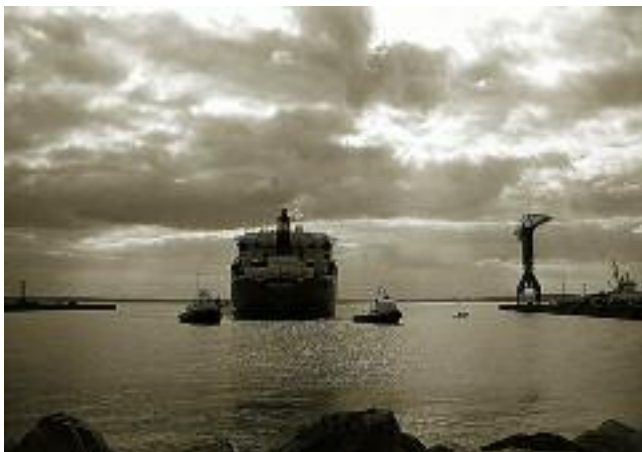
Photographie de Louis Brauquier

Quel plaisir que de redécouvrir réunies dans le recueil "Je connais des îles lointaines" les oeuvres poétiques complètes de Louis Brauquier rééditées avec bonheur par les Editions de la Table Ronde. "Et l'au-delà de Suez", "Le Bar de l'Escale", "Eaux Douces pour Navires", "Pythéas", "Libertés des Mers", "Ecrits de Shangai", "Feux d'Epaves", "Hivernage", "Le Cyprès Couronné de Myrthe" (provençal et traduction) : ils sont tous là, ces poèmes qui plantent le décor des grandes villes portuaires où Marseille occupe une large place, figent en instants magiques le mouvement des navires, les voyages, l'exil et les amitiés lointaines, et chantent la mélancolie de la Provence et son âpre beauté.