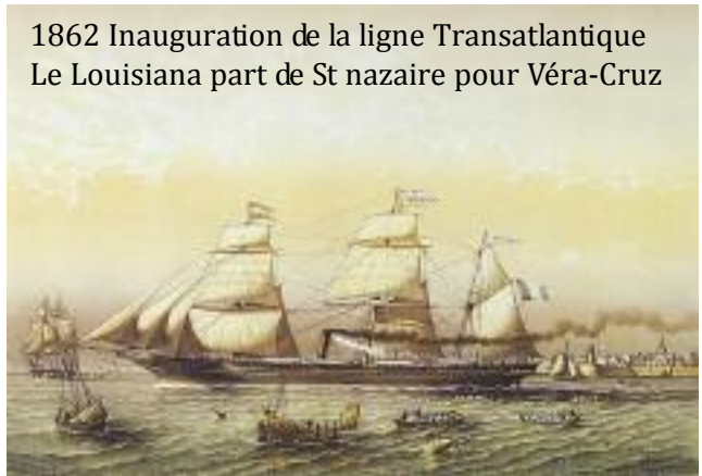
1862 Inauguration de la ligne Transatlantique Le Louisiana part de St nazaire pour Véra-Cruz