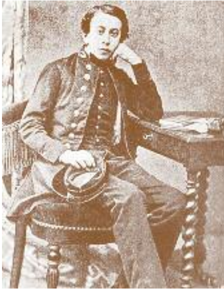
Tristan Corbière 1845-1875